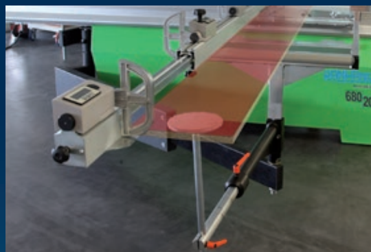
Plateau support additionnel confort pour faciliter l'appui des pièces longues contre le guide transversal