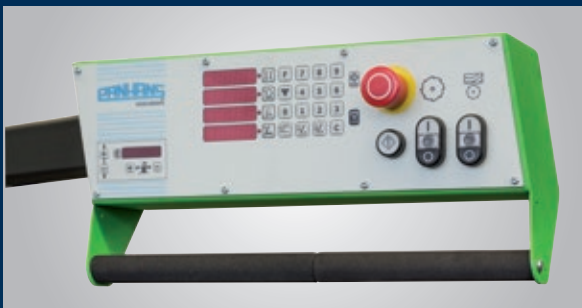
680|20 panneau de commande à hauteur des yeux