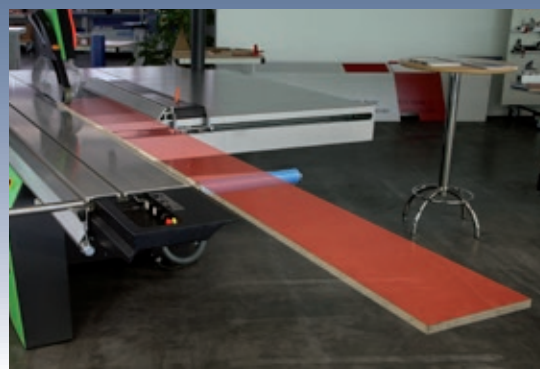
Innovant Support d'appui complémentaire