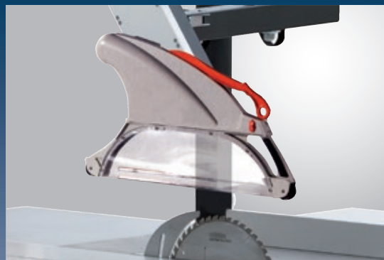
Capot de protection pivotable pour toutes les positions de la lame de scie