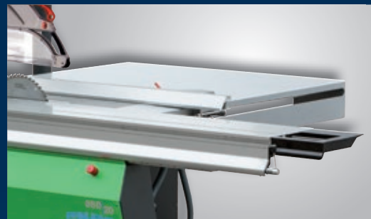
680|20 guide parallèle à déplacement motorisé

Les modèles 680/10 et 680/20 incarnent une nouvelle génération de scies à format qui apportent une harmonie, des caractéristiques, de la couleur et du concept.