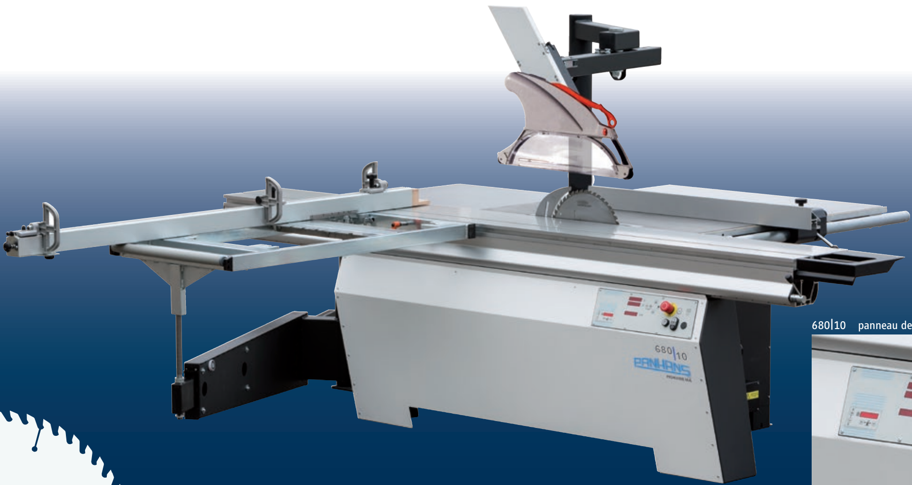
680|10 panneau de commande au bâti machine